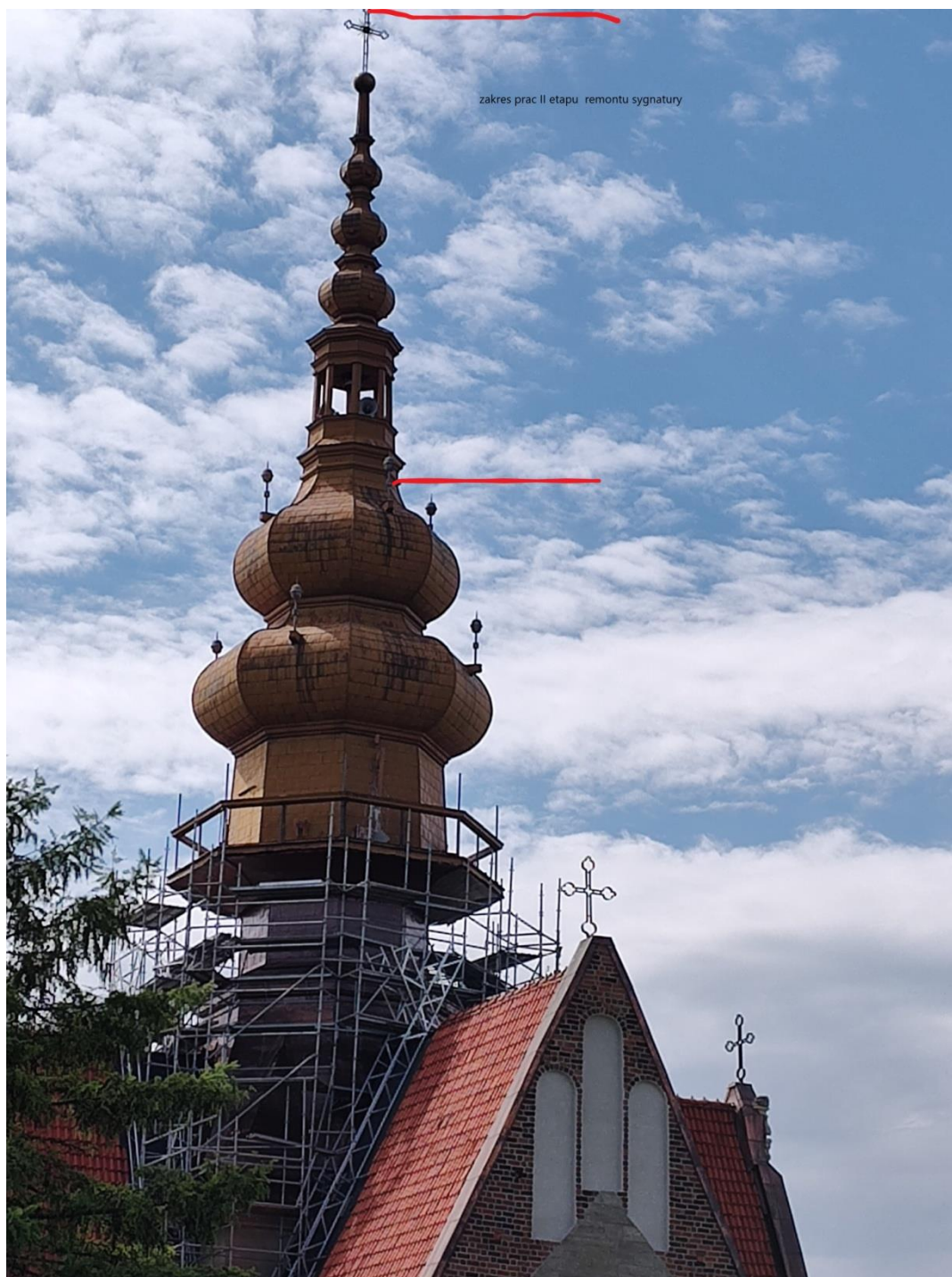
Zakres prac przewidzianych w II etapie remontu