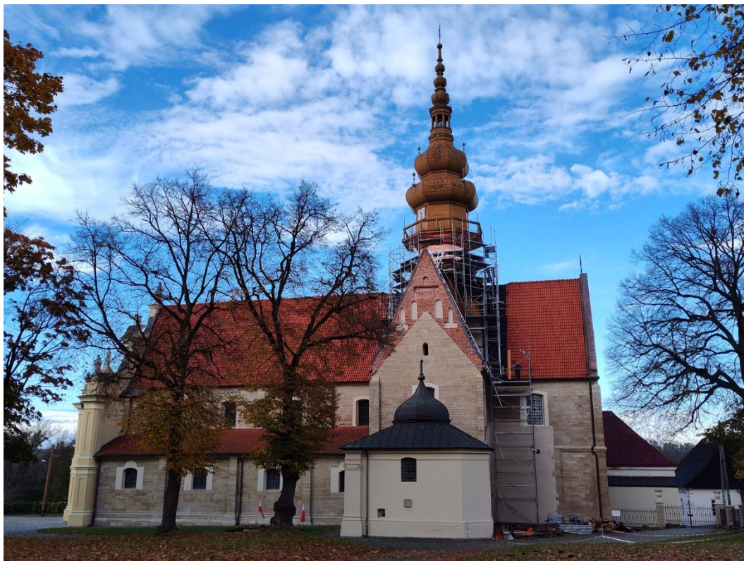
1-Widok ogólny obiektu